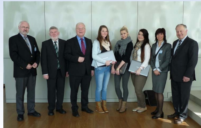
Netbookpreisverleihung BBS Verden 2013